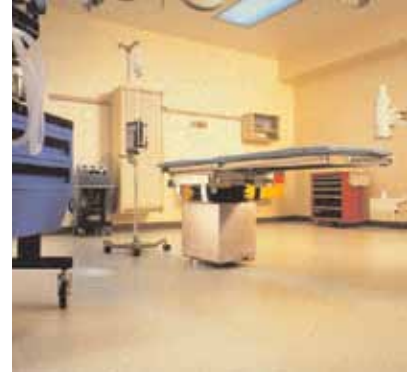
Kaplama yapılmış hastane odası