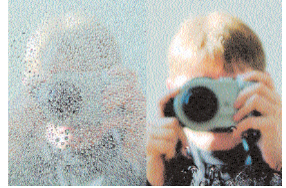
Soldaki normal camda, sağdaki ise nanoteknolojik kendi kendisini temizleyen camda yağmur sonrası görüntüdür.